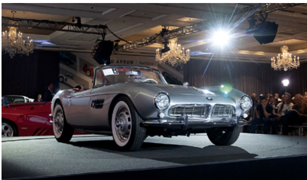
1958 BMW 507 Series II Roadster – Lot 274