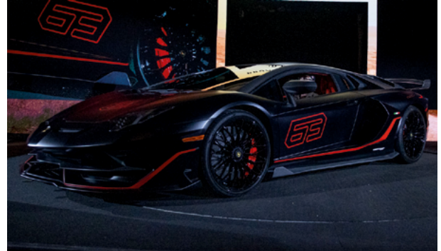
2019 Lamborghini Aventador SVJ 63 – Lot 139