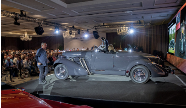
1935 Auburn 851 Super-Charged „Boattail“ Speedster – Lot 271