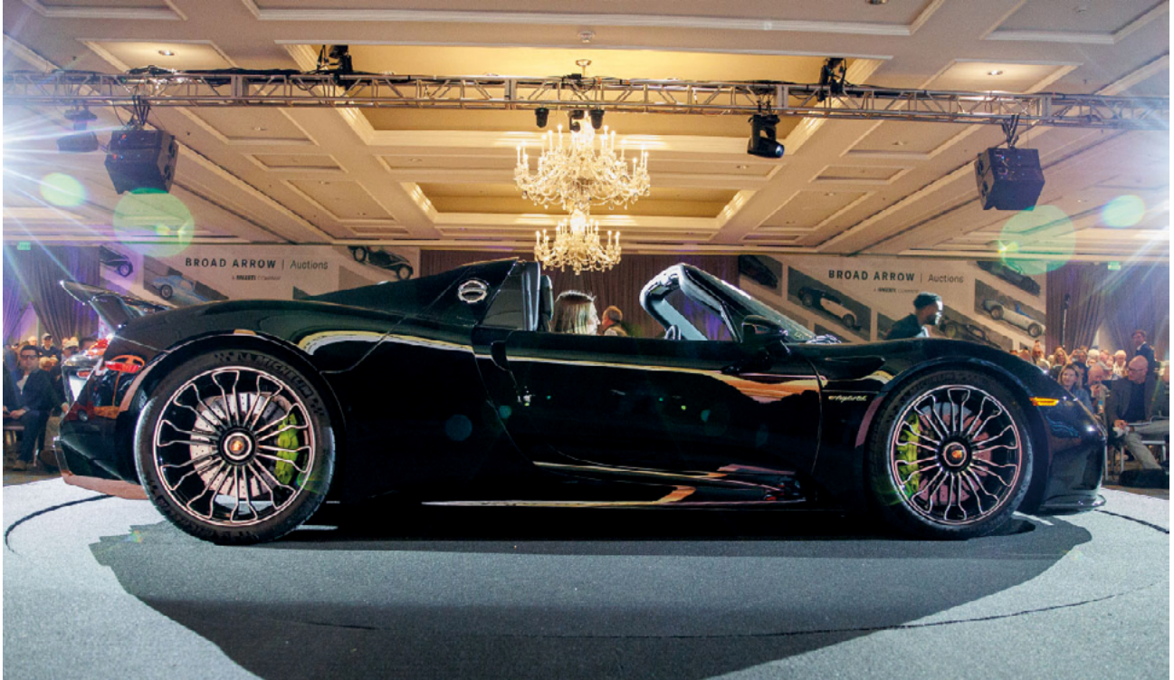
2015 Porsche 918 Spyder – Lot 121