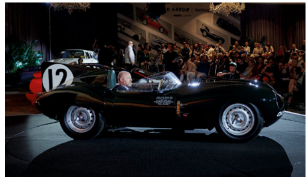
1954 Jaguar D-Type „OKV 2“ Works Competition – Lot 278