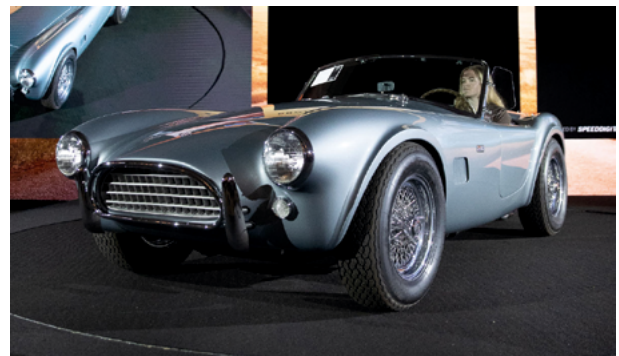
1964 Shelby 289 Cobra – Lot 127