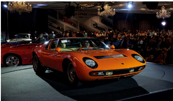
1971 Lamborghini Miura P400 SV – Lot 225