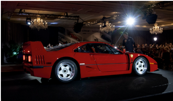
1990 Ferrari F40 – Lot 266