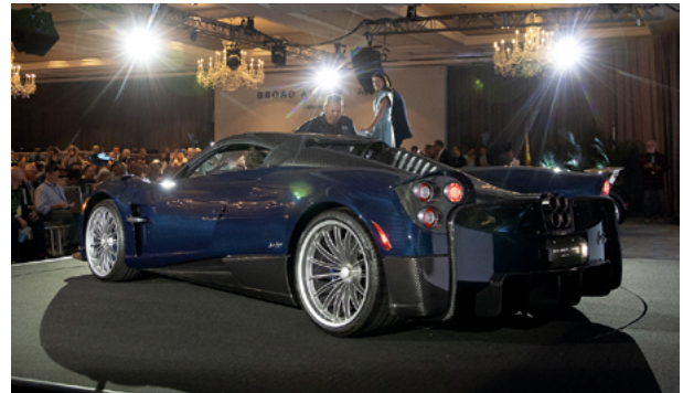
2018 Pagani Huayra Roadster – Lot 245